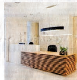
Die Arztpraxis in Straelen entwarf Dirk Pidun .