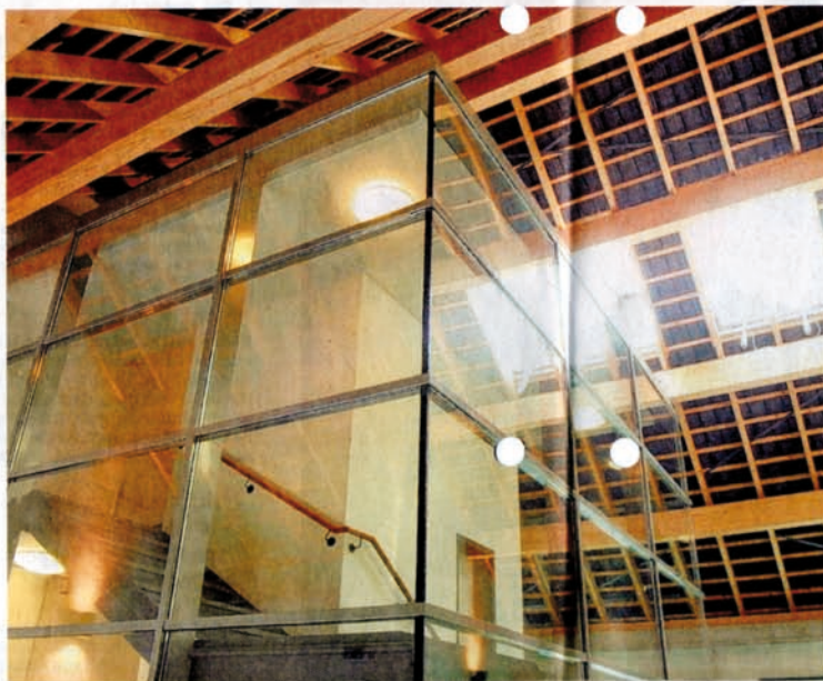
Blick auf den neuen Treppenturm und die Dachkonstruktion des alten Bonshofs in der alten Scheune. Karl Schroers sä-nierte den Bau aufwändig.

Zum Tag der Architektur sind aufwändige Modelle zu sehen – vom Büro Lemmens sowie den Designer-Büros Visent und Kompliment.