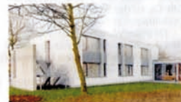
Das Wohnheim Münze in Kleve von Wrede-Architekten .

Am Tag der Architektur öffnen sie ihre Pforten, man lädt ein zum Gespräch zwischen Architekt und Bauherr, kann Ideen sammeln, für den eigenen Neubau oder aber die Änderungen im Bestand. Oder sich erste technische Infos zu einer energetischen Sanierung holen. Denn die Architekten und Mitarbeiter sind vor Ort. Energetisches Bauen ziehe sich wie ein roter Faden durch die gezeigten Objekte, heißt es von Seiten der Kammer. „Der Tag der Architektur soll für die Besucher Anregung und Inspiration sein, aber auch die Einladung zum Dialog mit Architekten und Stadtplanern“, sagt Kammerpräsident Hartmut Miksch.