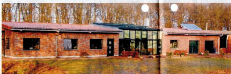
Flach und geduckt stand der Hühnerstall auf dem großen Grundstück – flach und geduckt musste auch das Haus sein, das in den Mauern des Stalls entstand – Nicole Danckwart wandelte den Stall zum Haus.