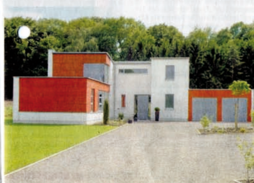
Das Büro und Wohnhaus Rütter-Santamaria in Kalkar entwarf der Klever Architekt Jürgen van der Louw .

lang ihm ein moderner klar gegliederter Bau, dessen Büro-Trakt ins Industriegebiet schaut, während der Wohnbereich sich zum Waldzug am Rand dieses Gebietes hin orientiert. Um die Gebäude-Ecke geführte Fenster lassen das Gebäude licht und luftig erscheinen – trotz seiner zwei Vollgeschosse. Hier ist ein lichter, zwei Geschosse hoher Glasbau das Scharnier zwischen Wohnen und Arbeiten.