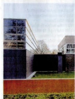
Die neue, moderne Turnhalle in Goch von Wrede-Architekten .