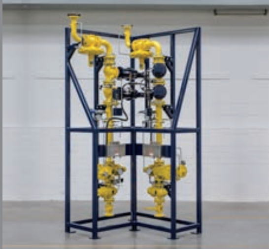
Sicherheits-Regelstrecke für Hochtemperatur-Schachtofenanlage Safety control loop for high-temperature for pit furnace system

Vertical control loop for DF engine with marine certification