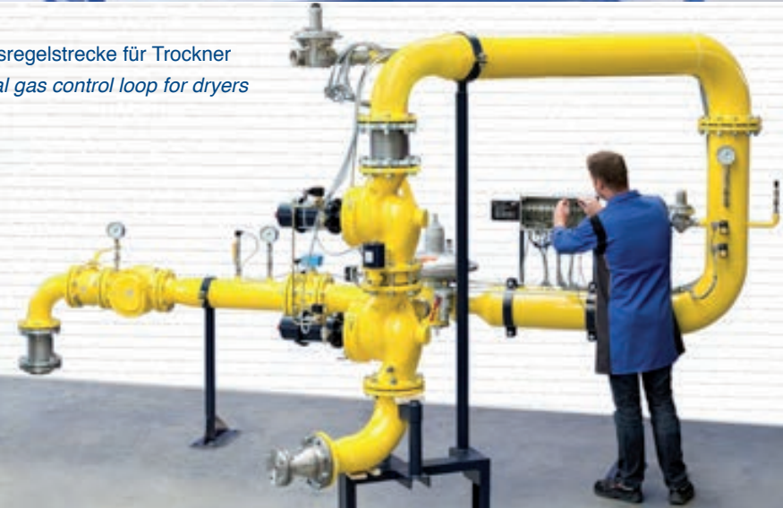
Erdgasregelstrecke für Trockner Natural gas control loop for dryers