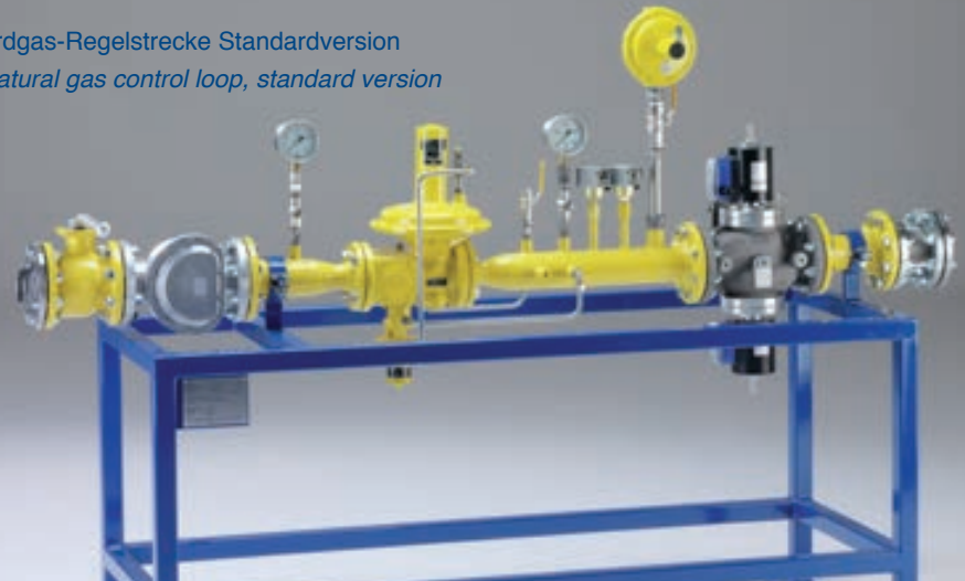
Erdgas-Regelstrecke Standardversion Natural gas control loop, standard version